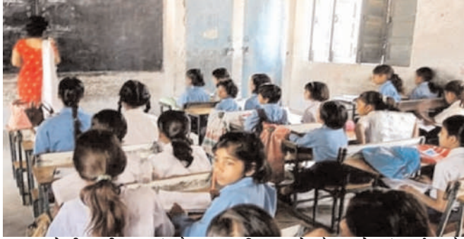
गायघाट से भी स्पष्टीकरण मांगा है।

पारू के प्रखंड शिक्षा पदाधिकारी व प्रखंड परियोजना प्रबंधक से तीन दिनों के अंदर स्पष्टीकरण का जवाब मांगा गया है। गायघाट के अलग-अलग स्कूलों में भी बच्चों की संख्या महज 40 से 50 फीसदी मिली। डीईओ ने बीपीएम