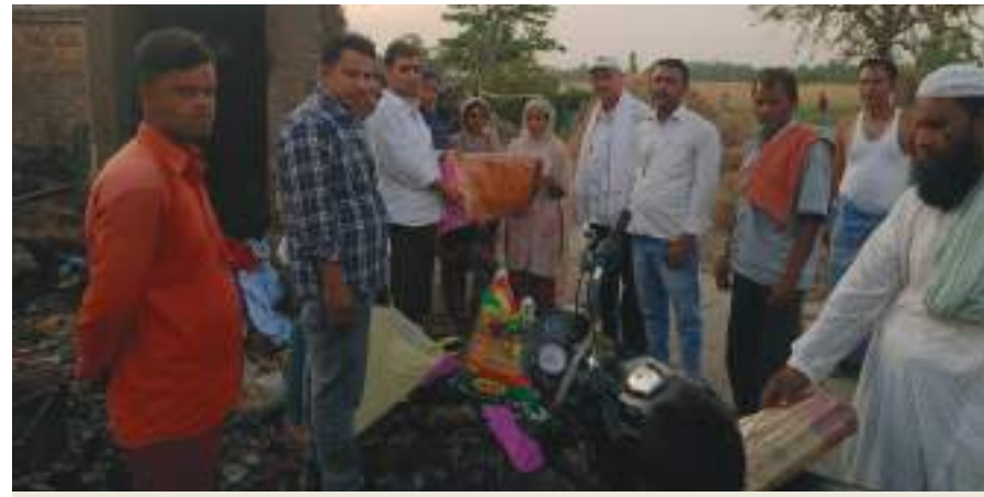
राहत सामग्री का वितरण करते समाजसेवी

वेज था। ग्रामीण जब तक गोलबंद होते और अग्निशमन यंत्र आया तबतक पांच घर जलकर बर्बाद हो गया। ग्रामीणों ने सीओ मझौलिया को सूचना दी, परन्तु प्रशासन की