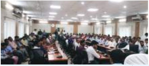
डीएम की बैठक में उमड़ी बैंकर्स की भीड़