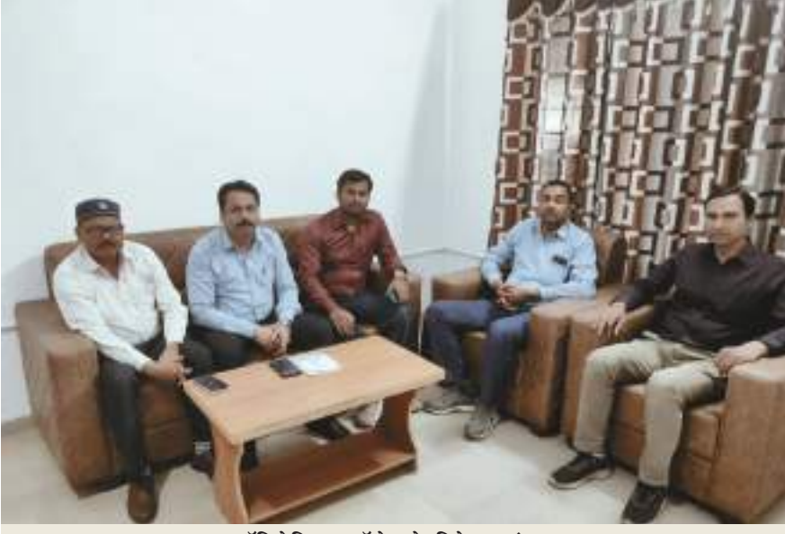
पॉलिटेक्निक कॉलेज के निदेशक मंडल

बेतिया। शिक्षित बेरोजगार युवकों के लिये खुश खबरी है। अब उन्हें बीबीए और बीसीए की पढ़ाई के लिये यूनिवर्सिटीज का चक्कर नहीं लगाना पड़ेगा। दुबौलिया स्थित शुभवन्ती इंस्टिट्यूट ऑफ प्रोफेशनल एजुकेशन संस्थान को वित्तीय वर्ष 2024-25 के लिए अखिल भारतीय तकनीकी शिक्षा परिषद ने अनुमोदन पत्र निर्गत किया है। जिसमें बीबीए और बीसीए कॉर्सेज को शामिल किया गया है। इस अनुमोदन के मिलने से संस्थान के चेयरमैन, ग्रुप डायरेक्टर, शिक्षकों, एवं छात्रों में खुशी की लहर है। क्यों कि इन विषयों का पुनः इस सत्र में नामांकन सह शैक्षणिक कार्य निष्पत्ति रूप से परिचालित होगा। इस अवसर पर हमारे ग्रुप निदेशक