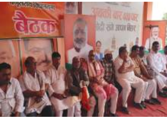
चाणक्य भूमि। बेगूसराय

लोकसभा चुनाव को लेकर राज्य की सियासत काफी गरमा गई है। पक्ष विपक्ष की ओर से लगातार एक दूसरे पर आरोप-प्रत्यारोप का दौर चल रहा है, इसी कड़ी में बेगूसराय में प्रेस कॉन्फ्रेंस कर भाजपा के फायर ब्रांड नेता गिरिराज सिंह ने विपक्ष पर जोरदार हमला बोला है। बेगूसराय से महागठबंधन की ओर से उम्मीदवार खड़े हुए हैं। और इस बार उक्कर सीपीआई वरुण बौध्या में होगी, भाजपा ने बेगूसराय से एक बार फिर गिरिराज