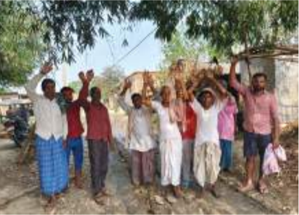
चाणक्य भूमि(कनक लता)

बेतिया। सिकरहना नदी के किनारे बसा गुदरा पंचायत के मुख्य सड़क पर जलजमाव एंवम बंदबंदार कीड़े वाला पानी को लेकर ग्रामीण परेशान है। ग्रामीणों का कहना है कि यह पंचायत प्रखंड से करीब 25 किलोमीटर की दूरी पर सुदूर इलाके पर स्थित है, यहाँ पर जनप्रतिनिधि और अधिकारी हमलों की शुद्धि लेने कभी नहीं आते है, लोगों ने बताया