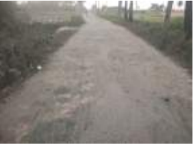
चाणक्य भूमि। खोदावन्दपुर/बेगूसराय