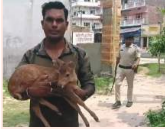
चाणक्य भूमि संवाद सूत्र