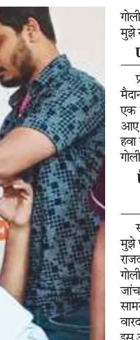
गोली लगी और मैं बेहोश हो गया। उसके बाद मुझे नहीं पता क्या हुआ।